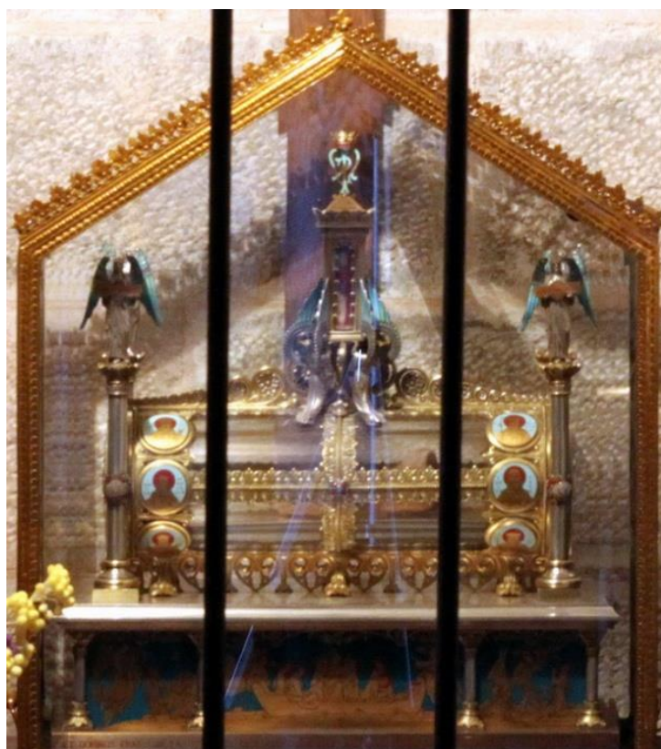
Mais alors d'o  viennent ces rayons bleus ? ? ? ? ?

J'ai plac  le tr pied   trois m tres de la niche puis cadr  l'appareil. L' clairage de la niche est assur  par un tube fluorescent jauni par les ann es et qui ne donne qu'une lumi re tr s faible. Et pourtant, malgr  cette faiblesse, d'autres rayons apparaissent sur deux de mes photos !!!!