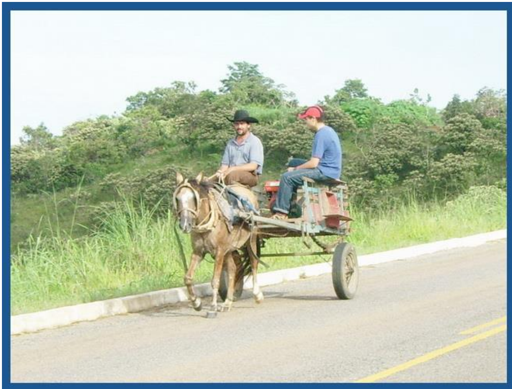
Au Brésil, tout se côtoie avec une très belle Harmonie...